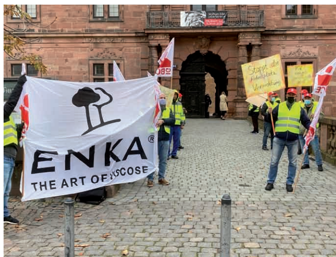
Lautstark demonstrierten zahlreiche ENKA-Beschäftigte für den Erhalt ihrer Arbeitsplätze während der Gläubigerversammlung vor dem Aschaffener Schloss.

Beide Geschäftsführer bedanken sich ausdrücklich bei allen Geschäftspartnern für die konstruktive Zusammenarbeit in den vergangenen Wochen und würdigten insbesondere das Engagement der Belegschaft. „Unsere Mitarbeiter haben sich unter schwierigen Bedingungen – Corona-Pandemie und Sanierungsverfahren – für den Erhalt ihrer Arbeitsplätze ins Zeug gelegt und haben ihren Anteil daran,