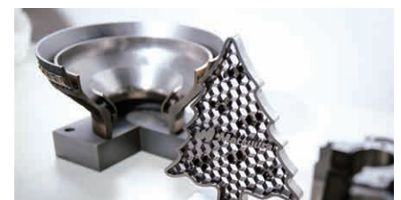
Komplexe Strukturen und Bauteile - hergestellt ICO mittels 3D-Drucktechnik im Open Innovation Lab (OIL) der Technischen Hochschule Aschaffenburg. (Foto oben).